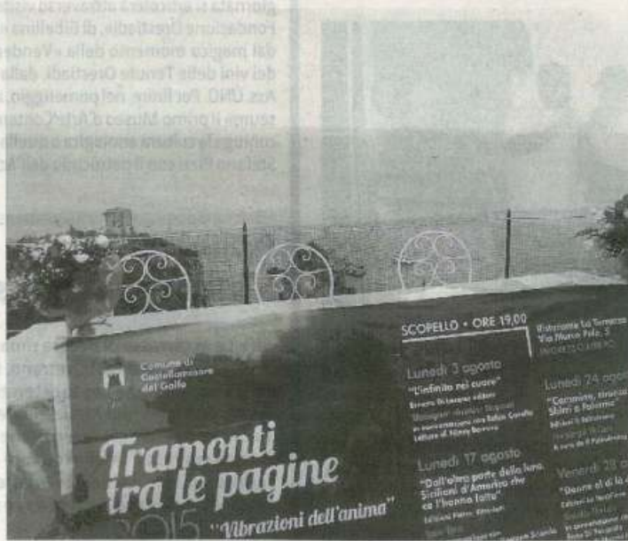
La terrazza di Scopello